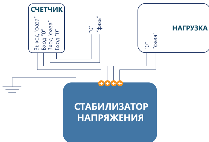
Рисунок 4.1 - Подключение стабилизатора напряжения

Проверьте отсутствие напряжения фазометром. Снимите крышку с клеммной колодки. Произведите подключение стабилизатора согласно рисунку приведённому ниже.